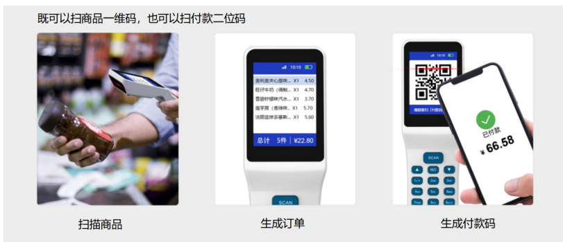
扫码收银 一机多用